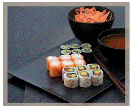
- publicité -

Cette reconstitution sera bien sûr une épreuve pour les deux jeunes filles, il va falloir refaire les gestes, redire les mots et revivre deux ans après un drame qui a bouleversé leur vie. Une épreuve aussi pour les