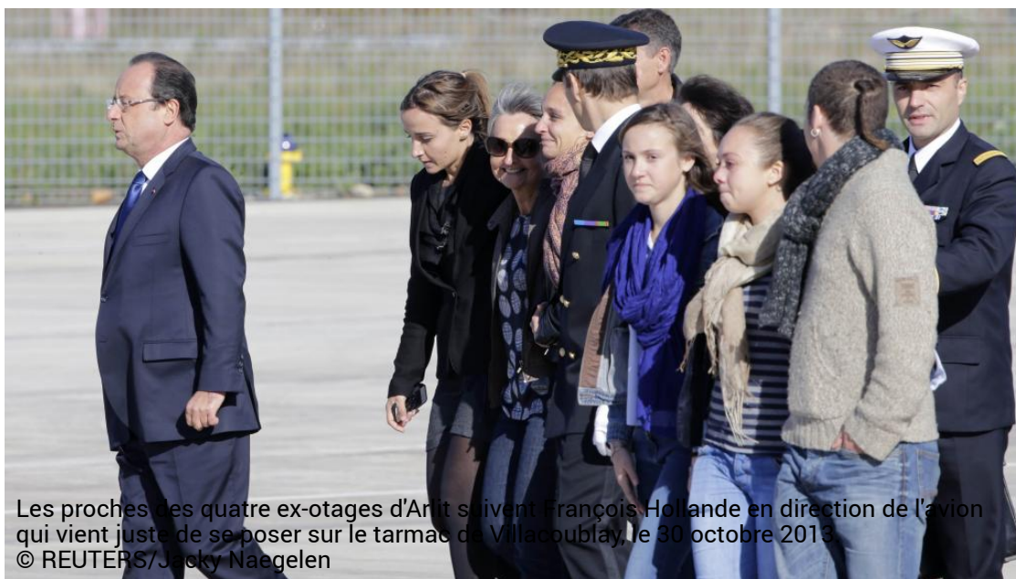
Les proches des quatre ex-otages d'Arlit suivent François Hollande en direction de l'avion qui vient juste de se poser sur le tarmac de Villacoublay, le 30 octobre 2013.